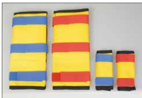
端子 100sq～325sq 迄 端子 14sq～60sq 迄