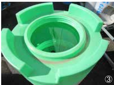
③クッションドラムに水を入れ、目印(1m)部分まで挿入。 ケーブル挿入時間：10時間