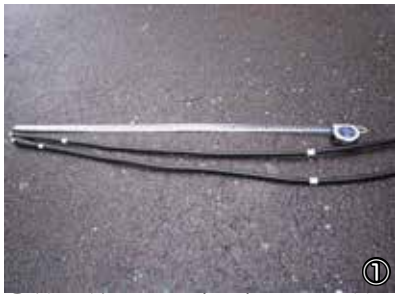
①給電線に目印(1m)を取り付ける。