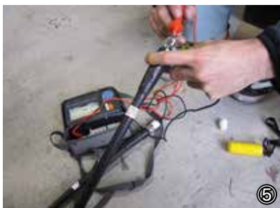
⑤絶縁抵抗計：SP コネクタ用防水接栓+ FK キャップ 絶縁問題無し。