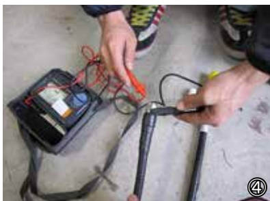
④絶縁抵抗計測定：SP コネクタ用防水接栓のみ。 結露によりわずかに浸水。