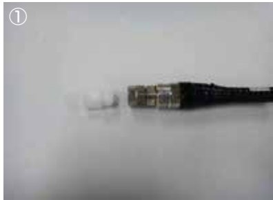
① SP コネクタ用防水接栓を給電線に装着。