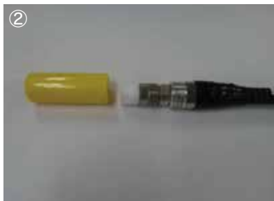
② SP コネクタ用防水接栓を装着した給電線に FK キャップを被せ二重防水。