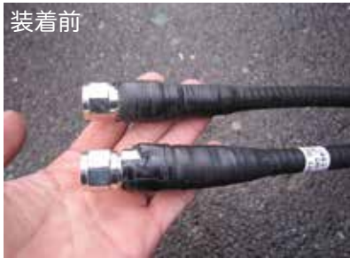
②上部：SP コネクタ用防水接栓のみ着用。 下部：SP コネクタ用防水接栓+ FK キャップ着用