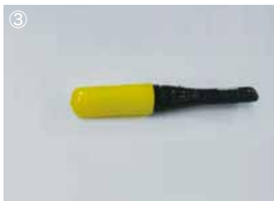
③ FK キャップを保護テープにて固定し完成。