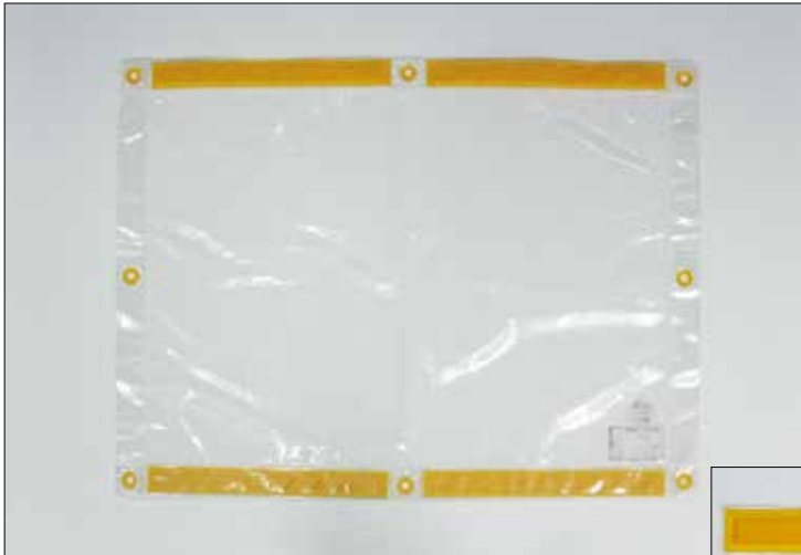
低圧透明養生シート（大）