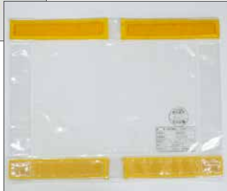
低圧透明養生シート（小）