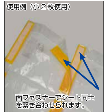
使用例 (小 2 枚使用)