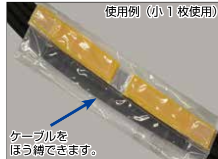
使用例 (小 1 枚使用)