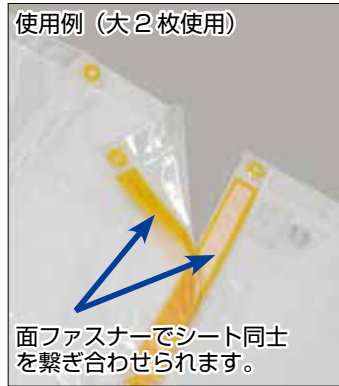
使用例 (大 2 枚使用)