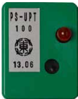
正常動作（ランプ消灯）