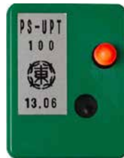
異常動作（ランプ点灯）