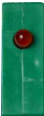
正常動作（ランプ消灯）