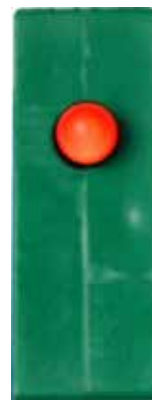
異常動作（ランプ点灯）

●正常動作の場合、反応がないことからテストヒューズ自体が正常に動作しているかが判別できるのは機器に何らかの異常があるときのみ。